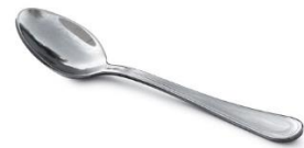
Une cuillère à café