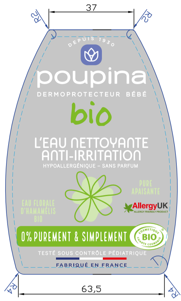
SUPPORT PP TRANSPARENT