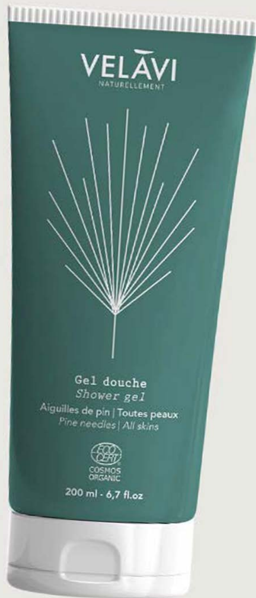
Gel douche - Aiguilles de pin €12,90